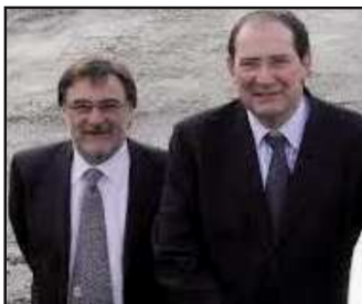
Galan e Chisso

Il conto è in arrivo anche per Renato Chisso. All'ex assessore regionale alle Infrastrutture, che fino a questo momento era rimasto ai margini del procedimento contabile, la Corte dei Conti si prepara a chiedere i danni per le tangenti del Mose, sia quelli di immagine che quelli per il disservizio. Sono le stesse contestazioni oggetto del processo tenutosi a palazzo Mandelli a carico dell'ex governatore del Veneto Giancarlo Galan. Lui, l'ex doge, non si è presentato in aula: motivi di salute hanno precisato i suoi legali spiegando che «è un altro uomo, non si riconosce neppure». Tanto che circolano voci, insistenti, su un possibile trasferimento all'estero. Certo che la nuova tegola non è delle più leggere: lo Stato gli chiede 5,8 milioni di euro, la difesa contesta la richiesta tout court e la definisce «spropositata». Sentenza tra un mese.