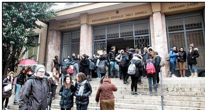
Il Liceo "Agli angeli"

zione di un'esperienza di alternanza scuola-lavoro. Le classi hanno raccontato l'ideazione di un'azienda di servizi per animali domestici e sviluppando il business plan, il sito internet, uno spot promozionale e un video di presentazione della realtà aziendale. Le scuole secondarie di primo grado hanno invece preso parte alla prova educativa "Acqua e riciclo a regola d'arte", cimentandosi nella creazione di opere d'arte sul tema del riciclo. Ad aggiudicarsi il primo premio è stata la scuola Mozzillo-laccarino di Manfredonia (FG). L'edizione 2017 del progetto educativo Fabbriche Aperte, patrocinato da CONAI, il Consorzio Nazionale Imbal-