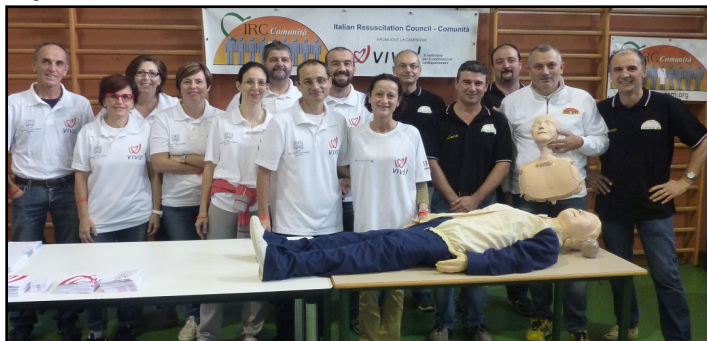
Lo staff che ha organizzato l'esercitazione

Una palestra affollata di ragazzi e ragazze tredicenni che fanno il massaggio cardiaco su appositi manichini al ritmo di "Staying Alive", l'intramontabile brano dei Bee Gees. Sarà più o meno questa la scena che si presenterà venerdì mattina, 20 ottobre, alle scuole medie Emilio Salgari di Negrar, in occasione di un corso sulle manovre rianimatorie di base promosso dal Pronto Soccorso dell'ospedale Sacro Cuore Don Calabria, diretto dal dottor Flavio Stefanini , che è anche Centro di riferimento didattico e formativo IRC. L'evento rientra nella settimana "Viva!", un'iniziativa voluta dal Parlamento Europeo per sensibi-