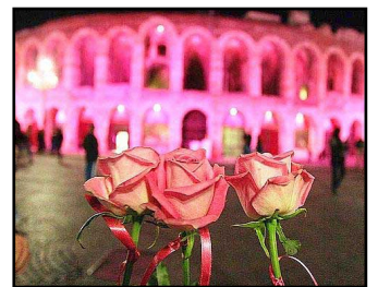
L'arena in rosa

Da sabato 21 ottobre l'Arena si illuminerà di rosa per promuovere la sensibilizzazione e la prevenzione del tumore al seno. L'accensione avverrà alle ore 19 di sabato e sarà preceduta alle 17.15 dal concerto del gruppo "Chorus" sulla scalinata di Palazzo Barbieri. Domenica 22 ottobre, dalle 9 alle 17.30, Andos sarà in piazza Bra con un gazebo per informazioni medico-sanitarie sulla diagnosi precoce del tumore al seno con i consigli dei radiologi.