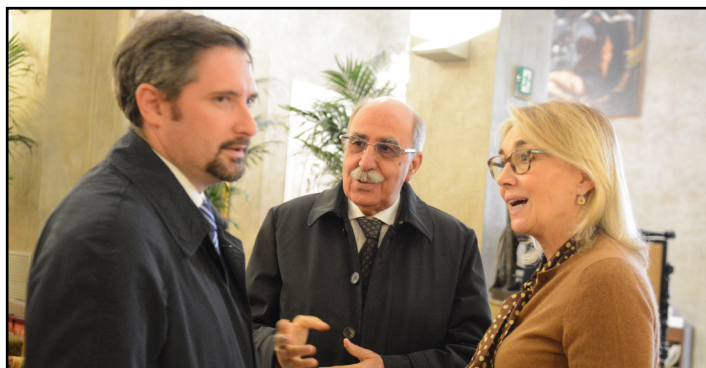
La conferenza stampa all'hotel Due Torri