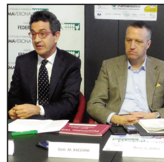
La cerimonia di consegna

Sono stati consegnati questa mattina presso la sede di Federfarma Verona i 10.739 farmaci (+ 2% sul 2016), valore di 67.250 euro, raccolti in 120 farmacie scaligere lo scorso 11 febbraio durante la Giornata di Raccolta del Farmaco 2017 a cura della Fondazione Banco Farmaceutico onlus grazie alla donazione dei cittadini veronesi. A beneficiarne sono i 35 enti assistenziali (tra gli altri, Associazione di Carità San Zeno, Gruppo Volontario Vincenziano, AIC Italia, Centro Accoglienza Minori, ecc...) convenzionati con il Banco Farmaceutico che a Verona assistono circa 22.000 persone in stato di disagio economico e sociale. «Sono positivamente sorpreso e mi congratulo con i veronesi per come hanno fatto fronte a questa esigenza sociale» afferma il Vescovo Mons. Giuseppe Zenti . «Le farmacie si confermano anche in questa occasione centro di erogazione di fondamentali servizi sociali» dice il sindaco Flavio Tosi . «17 anni fa è iniziata la collaborazione di Federfarma, cioè delle farmacie veronesi, con il Banco farmaceutico e quindi con gli enti assistenziali - dice Marco Bacchini , presidente di Federfarma Verona-. Nel corso del tempo è aumentata la partecipazione delle farmacie aderenti all'iniziativa umanitaria, ogni anno se ne aggiungono infatti 5/10, contribuendo in modo attivo alla buona riuscita della raccolta».