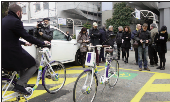
La conferenza stampa nella sede di Agsm