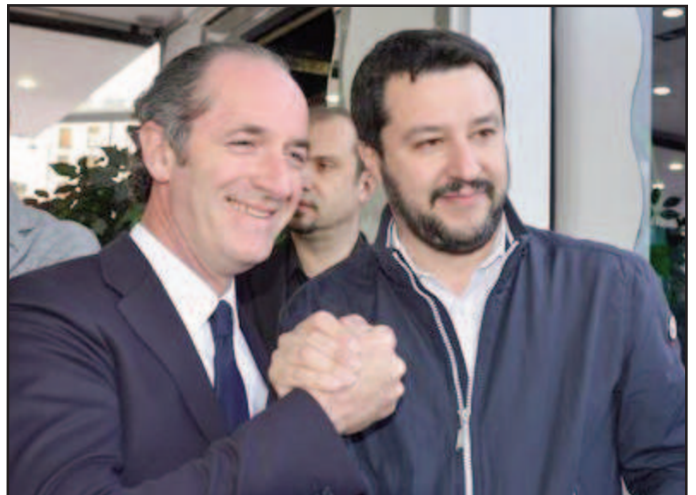
Zaia e Salvini

«In autunno ci saranno i referendum per l'autonomia in Lombardia e in Veneto»: lo ha detto il leader della Lega, Matteo Salvini , intervenendo al pranzo in suo onore, che è stato organizzato dagli 'Amici della lirica' di Milano, all'hotel Principe di Savoia. Salvini ha spiegato di non ritenere archiviata la storia della Lega Nord, ora che è diventata a vocazione nazionale. «Io dico 'autonomia tutta la vita, federalismo tutta la vita'. - ha detto - Gianfranco Miglio era ed è un genio, ma rispetto a vent'anni fa oggi abbiamo in tasca una moneta unica e il 75 per cento delle leggi le impone l'Ue». Per questo, è la linea del segretario del Carroccio, in Italia «o vinciamo tutti insieme o perdiamo tutti insieme». Se Silvio Berlusconi «lo vuole fare», un accordo, «sono la persona più felice del mondo, perché più larga è la squadra, meglio è. Ma siccome il centrodestra in passato qualche erroruccio lo ha fatto, non sono disposto a imbarcare chiunque, non i