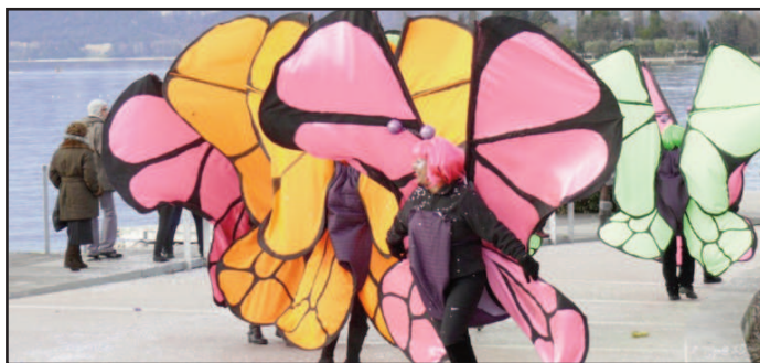
Maschere a bardolino

Sabato 25 febbraio torna a Bardolino l'appuntamento con il carnevale di Bacco e Arianna, l'evento dedicato ai più piccoli che porterà nei vicoli del centro storico e sul lungolago, decine di maschere e gruppi folkloristici provenienti da ogni parte d'Italia. La partenza è prevista alle 14.30 da Piazzale Gramsci per poi toccare, tra le altre, Piazza Lenotti e Piazza Guerrieri, terminando la passerella in Piazza del Porto. La sfilata conterà circa 500 maschere. Come tradizione saranno i bambini i veri protagonisti della giornata, con numerosi punti dove poter attendere il passaggio delle maschere in compagnia di attrazioni e giochi. In Piazza Catullo, ad esempio,