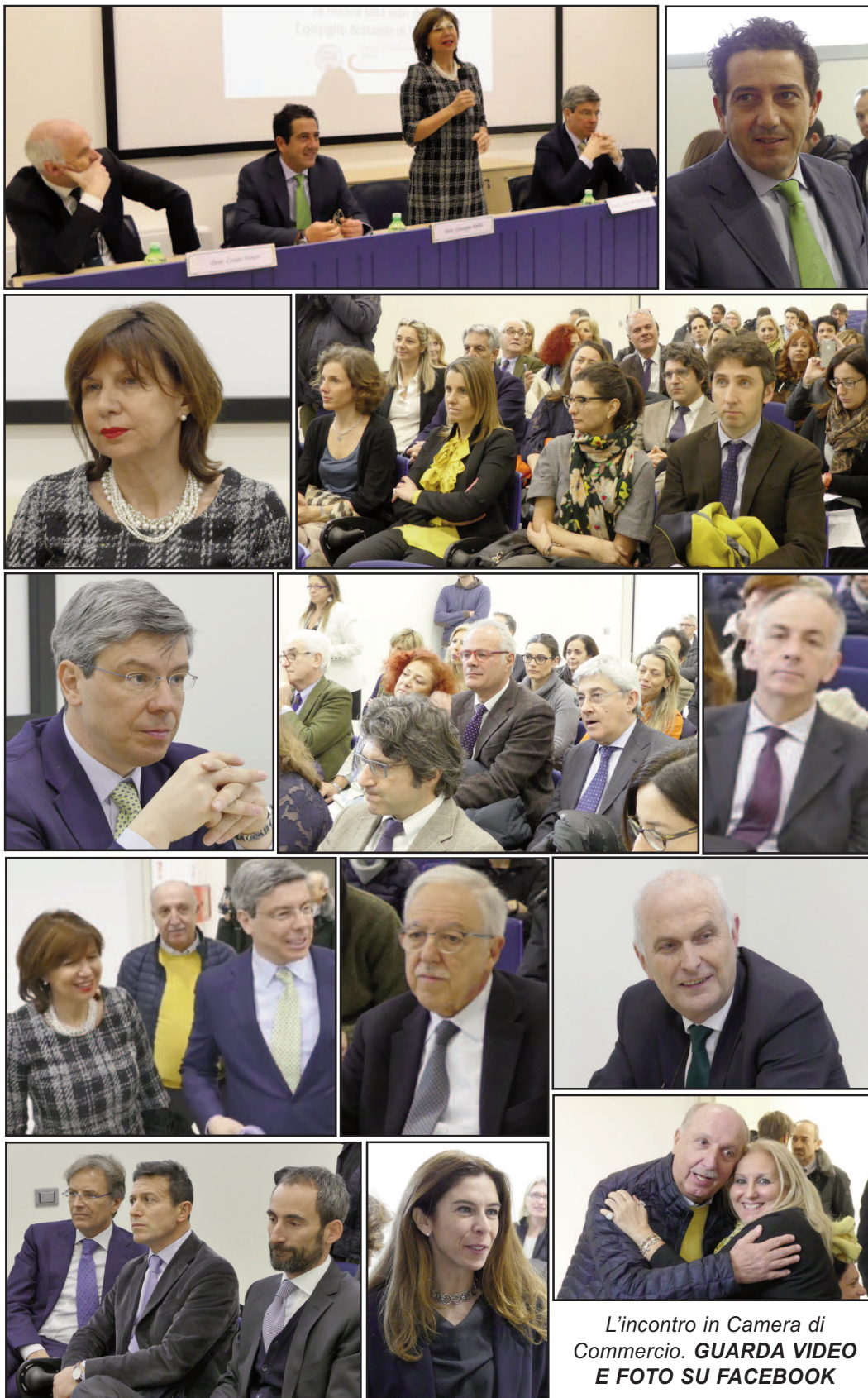
L'incontro in Camera di Commercio. GUARDA VIDEO E FOTO SU FACEBOOK

GUARDA IL SITO WWW.CRONACADIVERONA.COM SEGUICI SUI SOCIAL NETWORK