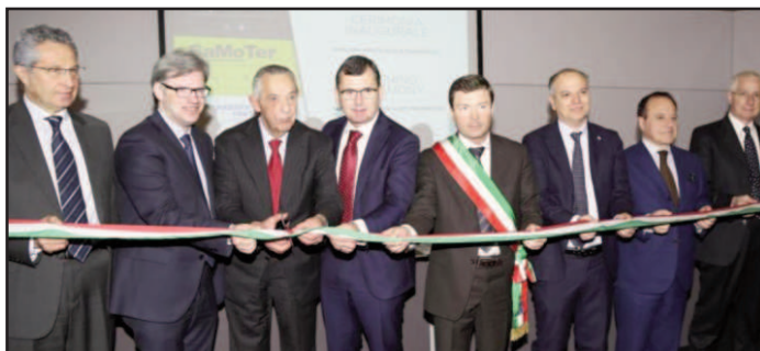
L'inaugurazione di Samoter