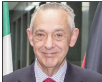
Umberto Del Basso De Caro

"Se il Cipe a marzo approverà il progetto esecutivo, nei prossimi mesi partiranno i bandi di gara e poi i lavori. Da quando consegnano l'opera i lavori si potrebbero finire in 36 mesi". Lo ha spiegato il sottosegretario ai Trasporti e alle Infrastrutture, Umberto Del Basso De Caro , all'inaugurazione delle fiere dedicate al trasporto, alla logistica e alle macchine da costruzioni Transpotec Logitec e Samoter, parlando della realizzazione della tratta dell'alta velocità che da Brescia arriva a Verona. Il sottosegretario ha risposto alle domande degli amministratori locali che gli hanno chiesto quando sarà pronta l'opera che vale 1,5 miliardi di euro circa. Il sottosegretario ha sottolineato come l'opera è importantissima ed essenziale per Verona. "L'impegno sull'altra velocità lo portiamo avanti - ha concluso - per la modernizzazione del Paese". (Segue a pag. 2)