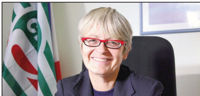
Anna Maria Furlan

Lo stabilimento della Coca Cola a Nogara è un modello produttivo "in grado di coniugare strategia globale, innovazione, qualità ed esigenze di sviluppo del territorio. Un modello che la Cisl intende salvaguardare e riproporre in altre aree del Paese, puntando su relazioni industriali sempre più partecipative, per favorire ulteriori investimenti produttivi e "occupazione per i giovani". E' quanto ha detto Anna Maria Furlan , segretario generale del sindacato di via Po, in visita allo stabilimento dell'azienda. "Il Veneto come tutto il resto del paese hanno bisogno di investimenti moderni e produttivi come ha fatto da tanti anni la Coca Cola, dove il