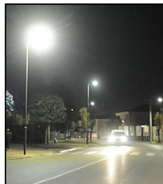
La nuova illuminazione

Presentato il piano di estensione dell'illuminazione pubblica a Verona nei quartieri, che sarà realizzato da Agsm Lighting nel 2017. Circa 120 le nuove lampade che saranno installate in luoghi non serviti dall'illuminazione pubblica, per una spesa complessiva di 217 mila euro. Dall'inizio dell'anno sono già stati posati 41 nuovi punti luce in via Fenilon, via Golosine, nell'area verde di via Prina, nel piazzale di via Montelungo, nel parco giochi di Madonna di Dossobuono, in largo Marzabotto, lungadige San Giorgio e via Ciro Menotti. Entro la fine del 2017 avranno nuova luce anche via Albere, via Pieve di Cadore, via dei Colli, via San Vincenzo, via Gaspari, contrada Clocego, piazzale L.A. Scuro, via Caperle, via Cappello, strada Schioppe e Corte Ca' Paioi, via Spina, via dei Reti, l'area verde di via del Ponte, via Negrelli, via Ca' di Cozzi, via Voltumo, via Legnago, contrada Avesani, piazzale Olimpia. Nel 2016 Agsm Lighting ha posato più di 350 nuovi punti luce per un totale di oltre 450 negli ultimi due anni. Come spiegato dal Sindaco, la programmazione di nuove illuminazioni sul territorio comunale viene approvata dall'Amministrazione comunale in base principalmente alle richieste che pervengono dalle Circoscrizioni, dai residenti e dalle Forze dell'ordine, per garantire ai quartieri più sicurezza e vivibilità.