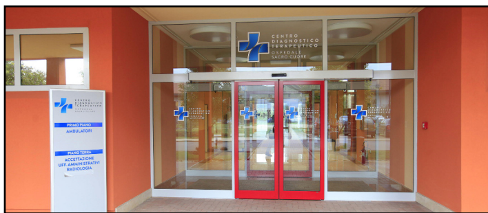
Il Centro Diagnostico Terapeutico di via San Marco

In occasione della Settimana mondiale della tiroide, che si tiene dal 21 al 27 maggio, e che quest'anno ha per tema “Tiroide e Benessere”, mercoledì 24 maggio gli specialisti dell'ospedale Sacro Cuore Don Calabria di Negrar incontrano la popolazione al Centro Diagnostico Terapeutico di via San Marco a Verona. Un'occasione per conoscere meglio una ghiandola fondamentale per il buon funzionamento del nostro organismo, per prevenire le malattie e per informarsi qual è il percorso di cura quando la tiroide si ammala. Il programma della giornata inizia alle 10 con un incontro aperto al pubblico a cui