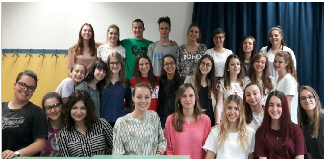
La classe vincitrice dell'istituto tecnico Marco Polo