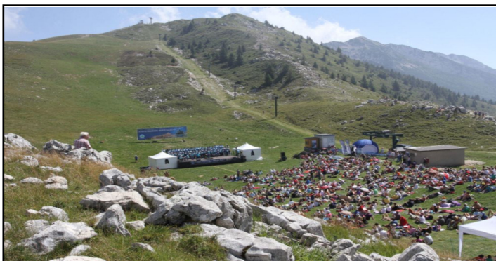
La precedente edizione

Domenica 24 settembre alle ore 14 il coro e il quintetto di ottoni dell'Arena di Verona torneranno protagonisti per la dodicesima edizione del concerto Con l'Arena sul Monte Baldo, organizzato dalla Funivia Malcesine-Monte Baldo in collaborazione con Fondazione Arena. Nella suggestiva cornice del Monte Baldo riecheggeranno arie tratte dalle più celebri opere di Bizet, Verdi, Mascagni e Bellini, ma anche brani di Charpentier, Mouret e Scheidt, per un appuntamento ormai tradizionale che richiama a partire dal 2004 un grandissimo numero di veronesi e appassionati. Per questo con-