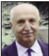
di Achille Ottaviani

La magistratura ha ripreso ad occuparsi della Pedemontana veneta. La procura di Vicenza ha aperto un'inchiesta legata al crollo colposo a seguito dell'ennesimo cedimento avvenuto nel cantiere della zona industriale di Castelgomberto. Il crollo ha interessato la volta della galleria della strada al suo imbocco in Valle dell'Agno. Secondo gli inquirenti ci sarebbero negligenze e responsabilità penalmente perseguibili. L'interesse della magistratura nei confronti della maxi opera che da anni attende di essere terminata, non è la prima e non sarà l'ultima. Lo scorso anno morì un operaio per essere stato travolto dal materiale franatogli addosso. E' chiaro che la Pedemontana sta diventando una nuova via Crucis dove appena si risolve un problema, ne nasce subito un altro. E' anche chiaro che la procura vicentina questa volta intende approfondire il legame tra le due inchieste. Magari unendola a quelle di cui si era occupata la procura di Venezia, tutte legate alle diverse autorizzazioni relative alla Pedemontana in quanto grande opera. Qualcosa sta bollendo in pentola, difficile credere che siano fagioli.