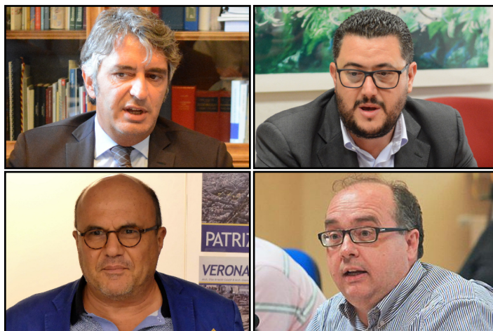
Sboarina, Polato, Caleffi e Bertucco

L'aveva promesso e l'ha fatto. Come annunciato, la Giunta comunale di Federico Sboarina ha deciso di revocare la delibera della Giunta di Flavio Tosi che, di fatto, avrebbe consentito la realizzazione del progetto di restauro presentato da Italiana Costruzioni per l'intero compendio. La revoca dovrà adesso essere votata, mercoledì prossimo, in Consiglio comunale. Per l'Arsenale, adesso, si pensa già ad un nuovo progetto, con appositi stanziamenti comunali (9 milioni sono già pronti per il 2018) e con varie ipotesi da discutere assieme alla città. La Giunta Sboarina ha intanto deciso che i 14 milioni e mezzo che la Giunta Tosi aveva messo a disposizione del project financing di restauro saranno dirottati per un milione verso la sistemazione di strade cittadine e per il resto verso lavori urgenti da realizzare in Arena, con la sistemazione dei gradoni ed anche la creazione di un percorso museale all'interno dell'Anfiteatro. Il sindaco Sboarina ha ribadito anche nel corso di una trasmissione televisiva, che l'Arsenale "dovrebbe rimanere in mano pubblica, ma non ho mai detto -ha aggiunto- che non ci dev'essere il supporto dei privati".