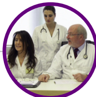
CHECK UP PERSONALIZZATI