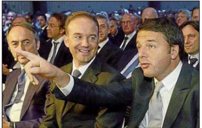
Renzi con Pedrollo

Quando sente l'aggettivo “sereno”, il nostro premier ci va a nozze Matteo Renzi. Sarà per questo (battute a parte) che il presidente del Consiglio, che oggi alle 13.30 piomba a Verona, vuole iniziare il suo tour proprio da... “Casa Serena”, la struttura comunale di San Michele Extra gestita dall'istituto Pia Opera Ciccarelli. Renzi vuole infatti manifestare l'attenzione del Governo alle strutture di eccellenza che operano quotidianamente al servizio dei più deboli. L'iniziativa è stata presentata ieri mattina da Alessio Albertini , segretario provinciale Pd Verona e dalla parlamentare Dem, Alessia Rotta . Si tratta sicuramente di una nuova iniziativa, visto che all'inizio, come annunciato in precedenza dal presidente di Confindustria Veneto, Roberto Zuccato , il premier accompagnato dal ministro Carlo Calenda doveva essere nella sede di Glaxosmithkline, in Via Fleming, per incontrare il mondo associativo, le imprese e le università del Veneto. Così, dopo Casa