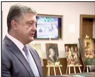
Poroshenko non molla i quadri