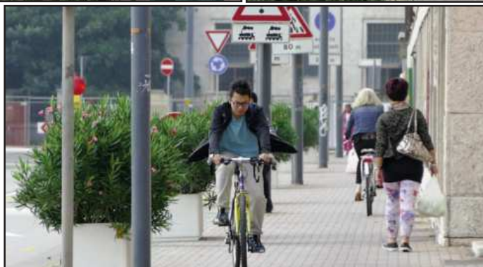
L'installazione delle fioriere in viale Piave