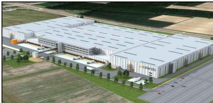
Il progetto del nuovo polo logistico

La piattaforma di vendite online tedesca, infatti, ha scelto il paese del Villafranchese come sede del suo nuovo hub centrale. Come annunciato ad agosto il colosso dell'e-commerce della moda, ha previsto di aprire due nuovi maxi poli logistici, uno in Italia, a Nogarole appunto, e l'altro in Polonia. Come riporta il Corriere del Veneto la nuova struttura, sarà simile alle cinque già attive tra Germania e Polonia, ma avrà il compito specifico di servire e velocizzare le spedizioni nei mercati del Sud Europa: nello specifico, Italia, sud della Francia, Spagna, Austria e Svizzera. «La notevole crescita di Zalando in Italia e negli altri mercati del Sud Europa – ha