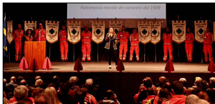
La cerimonia in gran guardia. Sopra Sboarina e Morbioli

Tutto per la Croce Verde di Verona l'auditorium della Gran Guardia dove si è svolta la tradizionale serata di consegna delle benemeritenze per anzianità di servizio. Uno ad uno sul palcoscenico si sono avvicinati i 260 soccorritori, tra volontari e dipendenti dell'ente di pubblica assistenza volontaria scaligera, premiati per l'instancabile attività umanitaria svolta al servizio della città. Una serata di festa, ricordi, lacrime di gioia e commozione nel corso della quale è stato più volte ribadito il fondamentale ruolo dell'ente nella geografia della sanità veronese. «La Croce