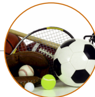
Medicina dello Sport