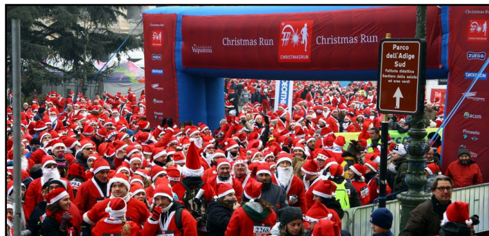
I Babbo Natale in partenza