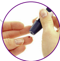
Endocrinologia e Diabetologia