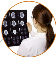
Neurologia e Neurochirurgia