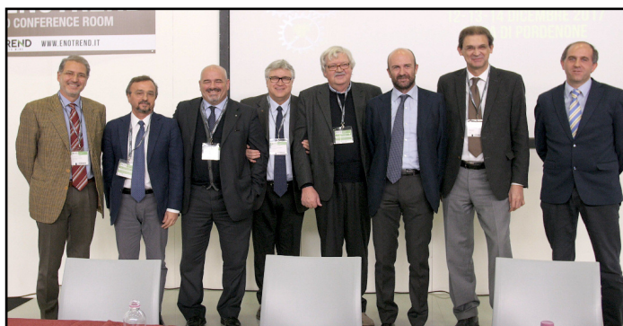
La firma dell'accordo

Rinnovo della piattaforma varietale e del miglioramento delle tecniche di coltivazione della vite, con l'obiettivo primario di migliorare la sostenibilità della viticoltura dal punto di vista ambientale, economico e sociale. È questo l'obiettivo dell'accordo sottoscritto dalle Università di Padova, Verona e Udine, la Libera Università di Bolzano, l'IGA Udine, la Fondazione Edmund Mach di San Michele all'Adige e il CREA Vitecoltura ed Enologia di Conegliano. Il protocollo, firmato il 14 dicembre