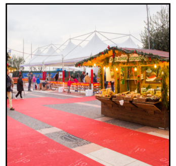
La pista di pattinaggio coperta

Weekend di grandi appuntamenti al villaggio di Natale di Bardolino, sul Lago di Garda. Si parte sabato 16 dicembre all'interno dell'area kids, la tensostruttura riscaldata dedicata ai bambini, con i giochi da tavolo e le attività proposte da Agsm Verona in collaborazione con Abeo e l'associazione Dadi in Biliko. Dalle 11 alle 18 i più piccoli saranno coinvolti in laboratori di pittura e disegno, oltre a poter scoprire nuovi e divertenti giochi creati artigianalmente. E mentre i bambini si divertono all'interno dell'area kids, i più grandi potranno godere, oltre che del mercatino di Natale, anche del vernissage “Le Case Danzanti” di Matteo Boatto, una raccolta degli ultimi lavori di una serie iniziata nel 1999 sulla tematica del luogo urbano. Domenica 17 spazio ai motori e all'antiquariato. Si parte la mattina sul lungolago Mirabello con l'esposizione di auto d'epoca e sportive a cura del Club Peschiera Motori, mentre su Lungolago Comicello torna fino alle 18 il mercatino dell'antiquariato e del vintage. Dalle 14 alle 16, invece, nella sede dell'associazione Canottieri Bardolino si terrà l'iniziativa “Rema con Babbo Natale”, dove poter provare gratuitamente le attività dell'associazione. Alle 15 tocca ai babbi natale in vespa, che faranno la loro apparizione in Piazza Lenotti, nei pressi della pista di pattinaggio coperta e il grande igloo bar.