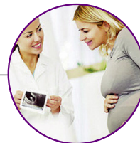
Ginecologia e Ostetricia