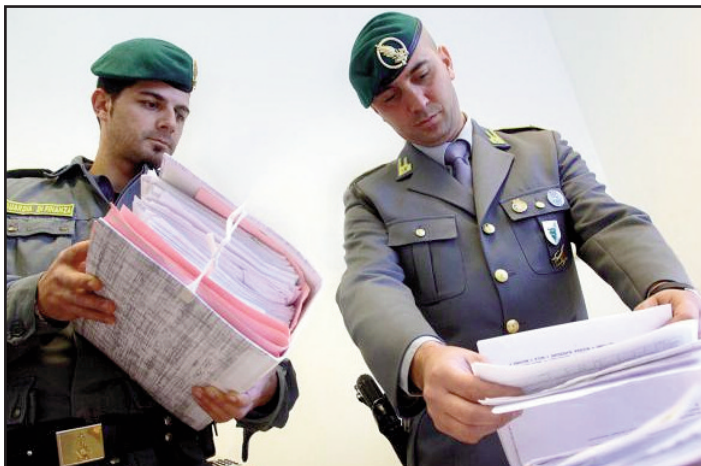
La Guardia di Finanza

La Guardia di Finanza di Desenzano, coordinata dalla Procura della Repubblica - Direzione Distrettuale Antimafia di Brescia, ha eseguito un'ordinanza di custodia cautelare in carcere emessa dal Gip del Tribunale di Brescia, nei confronti di un imprenditore veronese operante nel Bresciano. La misura restrittiva segue l'esecuzione di un'altra ordinanza di custodia domiciliare, avvenuta nel mese di novembre 2017, nei confronti di una donna veronese e di successivi sequestri di beni del valore di oltre 4 milioni di euro. L'operazione della Finanza, demoniata "Atlantis", è stata avviata grazie alla costante azione di analisi sulle cessioni di immobili di valore che caratterizzano particolarmente tutta la zona gardesana. L'attenzione degli investigatori è ricaduta su una villa di Sirmione, il cui basso valore di vendita è subito apparso anomalo rispetto alle quotazioni di mercato e allo stato di assoluto prestigio del fabbricato, in eccellenti condizioni, circondato da un ampio parco, con un porticciolo privato ed addirittura un eliporto. Approfondendo gli accertamenti, i Finanziari hanno scoperto che la società venditrice della villa, non solo aveva dichiarato un valore di