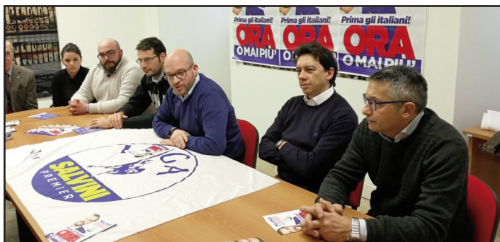
La Lega presenta l'iniziativa di Milano

"Sabato saremo a Milano con circa un migliaio di veronesi, tra chi utilizzerà i pullman e chi i mezzi personali. Il vento è molto positivo, ce lo dimostra l'affetto, la curiosità e l'attenzione della gente a gazebo ed eventi Lega. Nel complesso a Milano prevediamo almeno 50mila persone. Puntiamo a diventare il primo partito della coalizione, con Matteo Salvini presidente del Consiglio". Così l'europarlamentare, vicesindaco e vicesegretario federale della Lega Lorenzo Fontana presentando l'appuntamento Lega di sabato 24 febbraio, alle 15 in piazza Duomo a Milano. "Sarà l'occasione - ha rimarcato Fontana - per rilanciare il nostro programma e