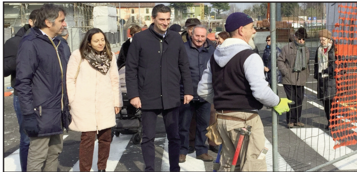
L'apertura di Borgo Santa Croce

Ha riaperto la viabilità all'interno della nuova lottizzazione di Corte Bentivoglio. Una risposta alle richieste dei cittadini, che ora possono fruire di nuovi percorsi di collegamento con il quartiere per spostarsi sia in macchina che a piedi, a vantaggio anche della viabilità della zona". Lo ha detto il Sindaco Federico Sborarina che, insieme agli assessori alla Viabilità e all'Urbanistica ha assistito alla rimozione delle reti che ostruivano il passaggio tra via Buzzati, via Spontini e la strada di collegamento con via Ruffo, e che, di fatto, impedivano non solo il transito, ma anche il collegamento con il