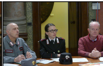
La presentazione per la Giornata Mondiale dell'Acqua in sala Arazzi

ne si snoderà nell'arco degli anni per giungere ai giorni nostri, raccontando il prezioso lavoro svolto dall'uomo nel corso dei secoli per consentire alla collettività di accedere a questo bene prezioso. La manifestazione è organizzata in collaborazione con il Comune di Verona, Legambiente, Agsm, l'associazione FIAB, i ragazzi della scuola media di Roverè Veronese e quelli del Liceo