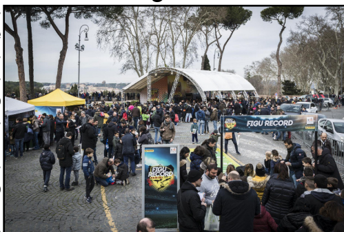
Un evento "Panini TourUP!"

pie e per partecipare alle "Figuriniadi", misurandosi con giochi a premio come il "Figu Record" In palio, l'"Almanacco Illustrato del Calcio 2018", zainetti, portachiavi e tante bustine di figurine. Inoltre, coloro che avranno completato interamente l'album potranno accedere all'area esclusiva del "Panini Box", dove riceveranno uno straordinario kit di regali e il prestigioso timbro ufficiale "Album Completato". Per facilitare