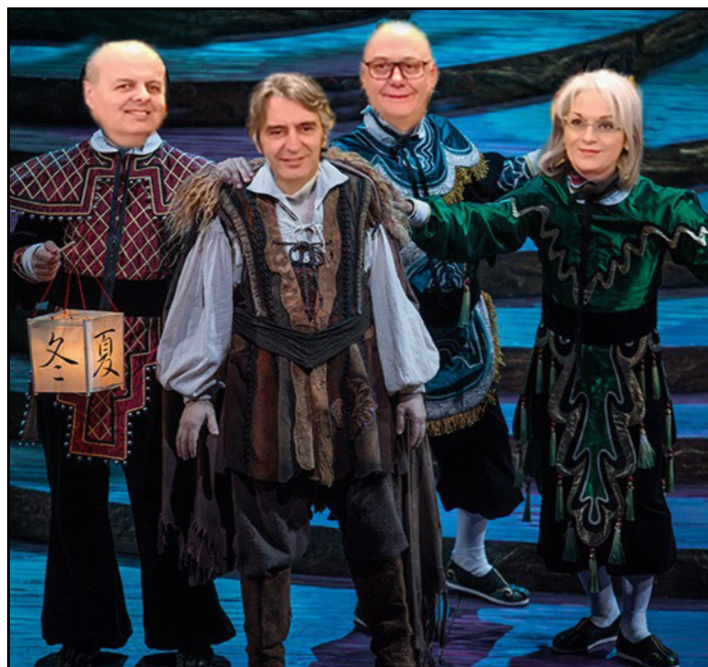
Il fotomontaggio con i quattro protagonisti

E in Arena squillò alto e forte l'acuto di Cattolica. Il Gruppo assicurativo guidato da Paolo Bedoni e Alberto Minali entra infatti nel Consiglio di indirizzo di Fondazione Arena, per contribuire al progetto di rilancio dell'ente lirico avviato dall'amministrazione attualmente retta da Federico Sboarina , che in Sala Arazzi ha ufficializzato il nuovo ingresso. Ancora in fase definizione la somma che Cattolica investirà per entrare come socio fondatore di Fondazione Arena, ma che dovrebbero corrispondere al 3 per cento della somma dei contributi netti approvati dall'ultimo bilancio di Fondazione e ad un ulteriore 5 per cento calcolato sul FUS, per due anni. "Sono orgoglioso", ha detto Sboarina, "perché si sta concretizzando quel progetto per il rilancio della Fondazione Arena a cui ho cominciato a lavorare dai primissimi giorni dopo l'insediamento; Cattolica entra come socia della Fondazione, seduta all'interno del Consiglio di indirizzo in modo pesante, con la figura apicale del presidente, e con un contributo economico importante per la Fondazione e suoi lavoratori. La soddisfazione è davvero grande - ha aggiunto il sindaco, "anche