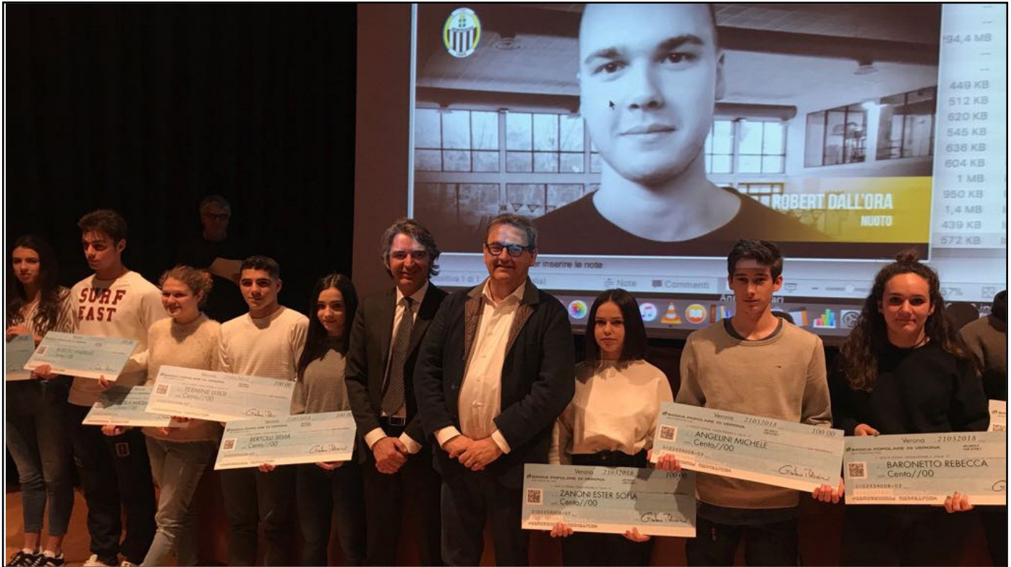
La Cerimonia di consegna delle borse di studio che si è tenuta alla Gran Guardia