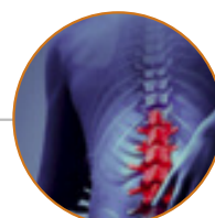
Centro per la cura del mal di schiena