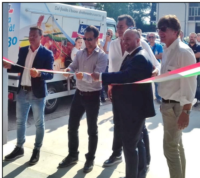
L'inaugurazione del nuovo spazio Bofrost

di qualità e ad alto contenuto di innovazione, come quelli che Bofrost da sempre propone, abbinandovi la consegna a domicilio che garantisce comodità e sicurezza della catena del freddo. La nostra filiale di Verona, che nel 2017 ha fatto registrare un fatturato di oltre 4 milioni di euro, ha quindi le potenzialità per fare ancora di più. Per questo abbiamo investito in nuovi spazi, più grandi e funzionali, per sostenerne la crescita». Una crescita che si accompagna anche alla creazione di occupazione. Nella filiale Bofrost di Lavagno, in via Volta 33, lavorano attualmente 37 persone. Entro fine giugno sarà completato l'inserimento di un'altra persona, mentre entro la fine del 2018 l'azienda ha in programma di effettuare fino a cinque nuove assunzioni di venditori che avranno il compito di visitare i propri clienti fidelizzati per poterli assistere nella scelta dei loro prodotti preferiti, a bordo di uno dei 22 mezzi refrigerati gestiti dalla