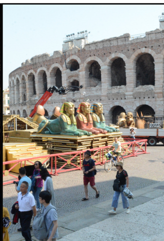
Lo spettacolo, dentro e fuori l'Arena

al massimo un brand che al mondo non ha eguali. L'Arena può davvero volare. Sarà questo il compito dei manager. Nel frattempo lo spettacolo comincia all'esterno dell'anfiteatro, dove tra sfingi e templi i turisti, ma anche i veronesi, passeggiano in un'atmosfera magica.