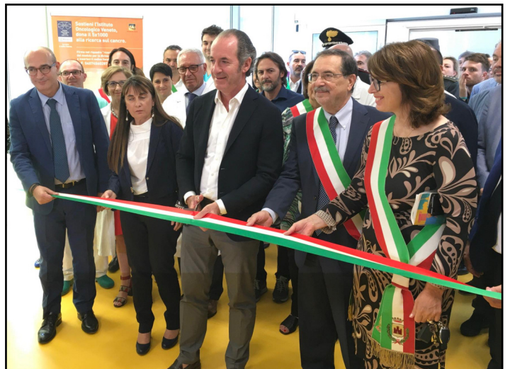
L'inaugurazione del "bunker" a Schiavonia

È un vero e proprio "bunker" per intensificare la guerra al tumore la nuova modernissima struttura del Servizio di Radioterapia dell'Istituto Oncologico Veneto (IOV), realizzata con un investimento di 12,7 milioni di euro, dove operano, tra l'altro, due macchinari per ora unici in Italia: un sistema radiante per tomoterapia denominato "Tomoterapia Radix Act" e un Tomografo Computerizzato "Simultac", che si affiancano a un Acceleratore Lineare di ultima generazione. L'avveniristica struttura, denominata "Bunker-iov" è stata inaugurata nelle adiacenze dell'ospedale Madre Teresa di Calcutta di Schiavonia, in provincia di Padova, dal presidente della Regione del Veneto. Le nuove strumentazioni consentiranno di accelerare le attività radiografiche, aumentando del 30% le prestazioni annue erogate dallo Iov. Dei 12,7 milioni di investimento, circa 6 milioni sono serviti per le opere murarie e il rimanente per l'acquisto dei macchinari. "Anche se per una certa 'lamentopoli' in sanità non andrebbe mai bene niente -