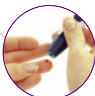
Endocrinologia e Diabetologia