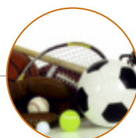
Medicina dello Sport