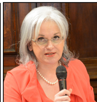
Uno scatto di "Carmen" e il sovrintendente Cecilia Gasdia

della Fondazione credono fortemente nel riscatto. Per il debutto, com'è consueto-