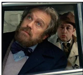
Gastone Moschin e Philippe Noiret

Un anno fa ci lasciava Gastone Moschin , straordinario attore veronese nato l'8 giugno 1929 a San Giovanni Lupatoto. Innumerevoli i suoi successi sia in ambito teatrale (tra gli altri ha fatto parte dello Stabile di Genova e di Milano e ha lavorato con maestri come Cechov ) che televisivo ("Il Mulino del Po", "I Miserabili") che cinematografico. Su tutti viene ricordato per la trilogia di "Amici Miei" in cui interpretava quell'inguaribile romantico dell'architetto Rambaldo Melandri . La foto lo ricorda nella mitica scena della "clacsonata" durante una delle zingarate assieme a Philippe Noiret , alias Perozzi , il giornalista.