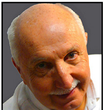
di Achille Ottaviani

Si ritorna dalle vacanze con nel cuore il lutto dei morti del ponte Morandi di Genova. Mentre i Benetton festeggiano a Cortina sul lago Ghedina e nel vecchio mulino lussuosamente ristrutturato, noi comuni mortali preghiamo per le vittime. Speriamo che le nostre preghiere tolgano a questi signori anche le concessioni autostradali. Tra queste attraverso gli spagnoli di Abertis c'è la nostra Brescia-Padova. Scrivevamo in epoca non sospetta che vendere le reti era una follia. Strade, autostrade, porti e aeroporti sono le vene pulsanti di una nazione. Siamo stati profeti delle disgrazie in patria. La Brescia-Padova non andava venduta perché non c'era alcun motivo, azienda moderna, competitiva, che produce utili di grande soddisfazione. Non solo dava lavoro e sicurezza a centinaia di persone che ora vivono in ambascie perché non certi del proprio futuro. Qualcuno ha deciso di farci un business e fare cassa. Errore gravissimo a cui Regione Veneto, banche, fondazioni e compagnie assicurative dovrebbero porvi rimedio. Certe tragedie italiane dovrebbero far diventare più saggi e lungimiranti certi nostri amministratori.