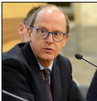
Nicola Sartor, rettore dell'Università di Verona

ambientale alle analisi di immagini per il forensics ambientale e ai sistemi intelligenti in ambito meteorologico. Sono previsti un project work ed una prova finale. Il corso si rivolge a tutti i professionisti che vogliono specializzarsi nel settore della meteorologia, dei controlli ambientali e del monitoraggio ambientale, in particolare a Laureati in scienza ambientale, fisica, informatica, ingegneria con interessi specifici nel settore della protezione dell'ambiente e della meteorologia.