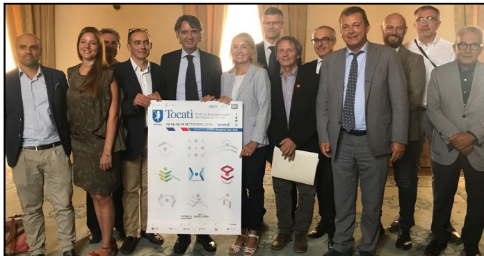
La presentazione della rassegna

Con 137 attività previste tra giochi, laboratori, conferenze, incontri e progetti collaterali, Verona è pronta ad ospitare la 16ª edizione del Tocati, in programma dal 13 al 16 settembre. Il Festival Internazionale dei Giochi di Strada, organizzato da Associazione Giochi Antichi con il Comune, torna quest'anno nella sua formula classica, con la Francia del Sud e la sua cultura ospiti d'onore dell'evento. Tra le novità del Festival: per la prima volta il MIBAC-Ministero per i beni e le attività culturali è parte attiva nella realizzazione dell'evento; l'anteprima ufficiale l'8 settembre in piazza Vinco a Borgo Venezia, in linea con la volontà dell'amministrazione di dislocare i grandi eventi anche fuori dal