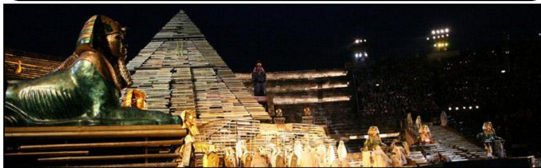
Un'immagine di Aida