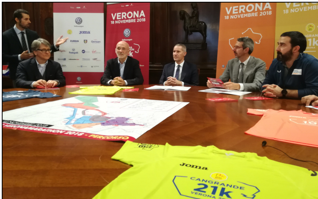
La presentazione di Volkswagen Veronamarathon

L'ex presidente scomparso nel luglio scorso. C'è un trofeo