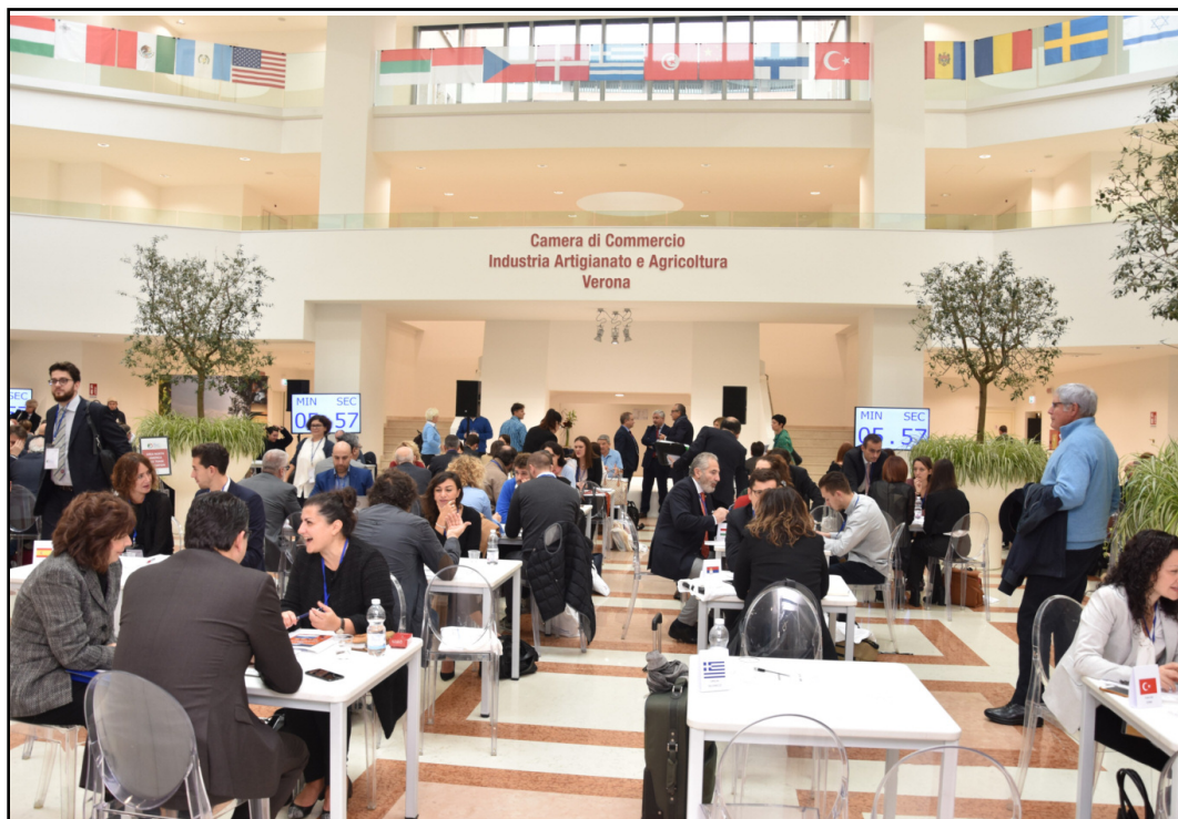
Gli incontri della convention mondiale delle Camere di Commercio italiane all'estero.