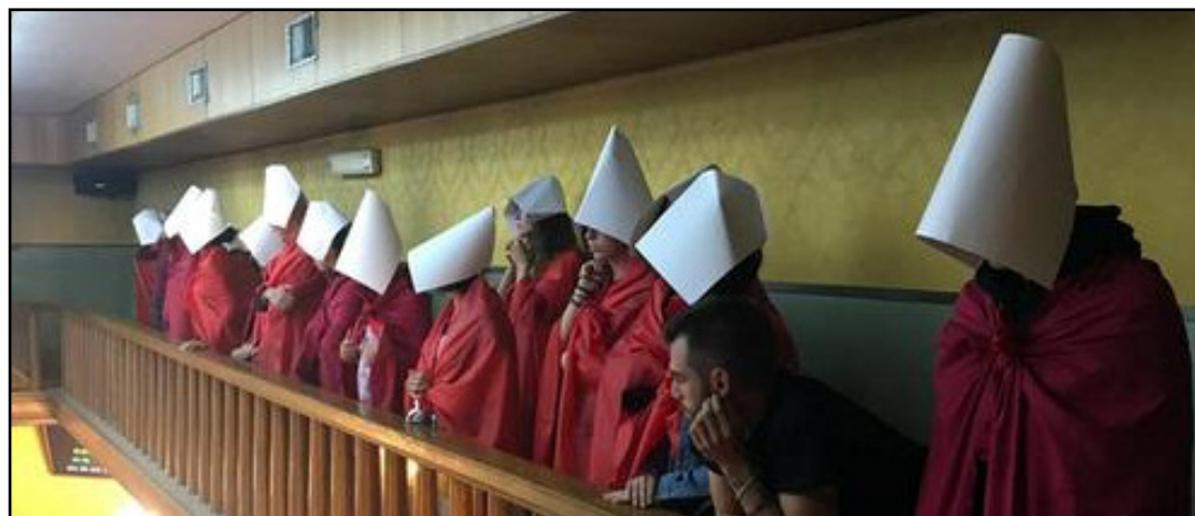
La protesta delle donne di "Non una di meno" a palazzo Barbieri

Dopo le mobilitazioni del 10 novembre in più di 60 italiane a fianco dei centri antiviolenza e di molte altre realtà, Non Una di Meno Verona propone un incontro formativo per spiegare che cosa contiene il