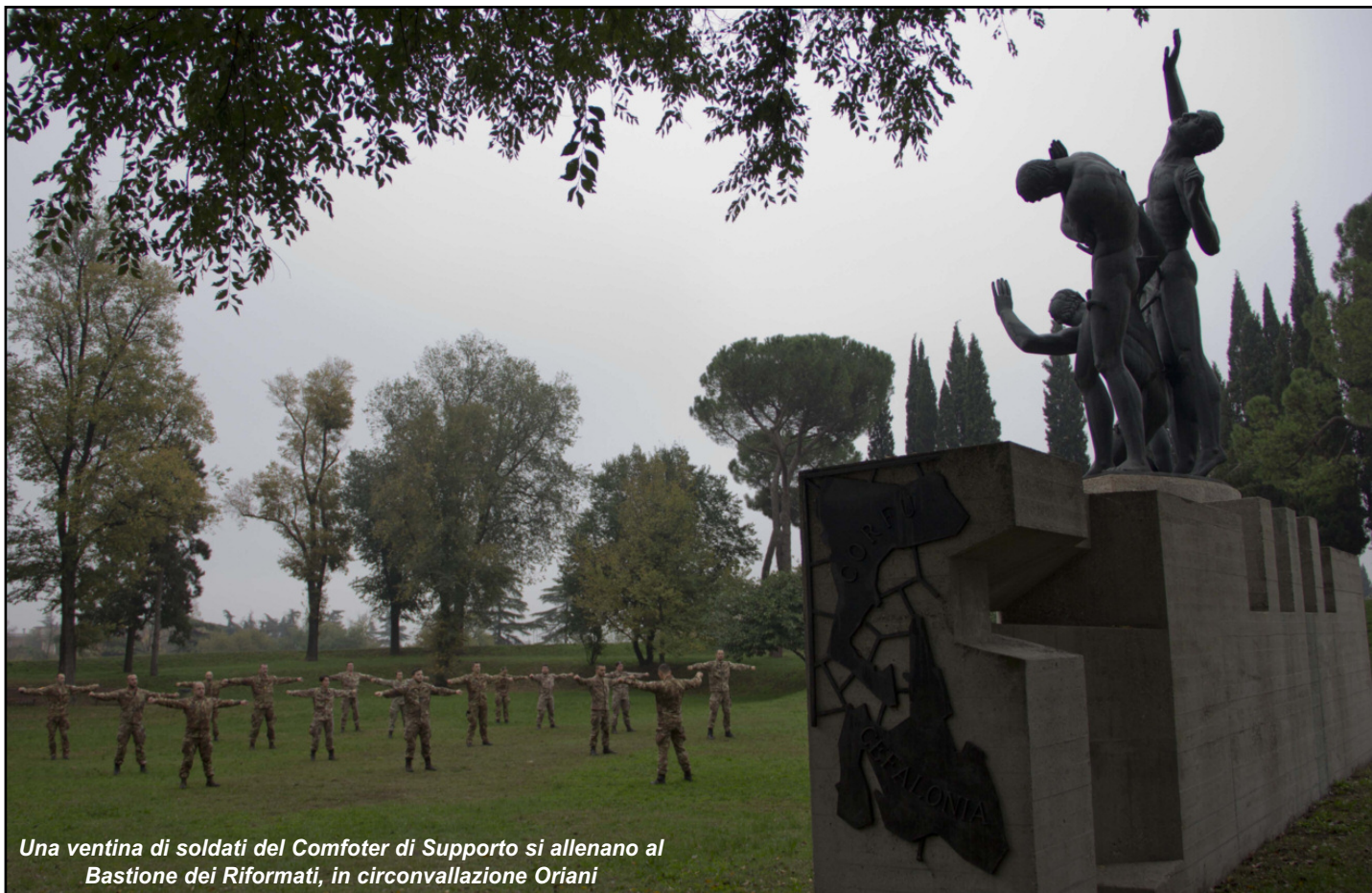
Una ventina di soldati del Comfoter di Supporto si allenano al Bastione dei Riformati, in circoscrizione Oriani