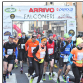
Montefortiana alla partenza

Una giornata ricca di appuntamenti quella del 20 gennaio a Monteforte d'Alpone, per tutti gli amanti della corsa che hanno la possibilità di correre sulle colline dell'est veronese alla Montefortiana. Organizzata dal GSD Valdalpone De Megni, la Montefortiana è famosa per la varietà dei suoi percorsi che accontentano proprio tutti, partendo dal Trofeo San Antonio Abate - Falconeri, la non competitiva di 9, 14 e 20km, che quest'anno giunge alla 44a edizione. Spazio anche ai competitivi che trovano qui a Monteforte la possibilità di scegliere tra tre gare differenti: la Maratonina Falconeri, l'Ecomaraton Clivus e l'EcoRun Collis. Per ancora qualche giorno le tariffe delle corse competitive saranno agevolate; dopo il 30 novembre tutti i costi subiranno un leggero rialzo: la Maratonina Falconeri e l'EcoRun Collis da 25€ saliranno a 27€, mentre l'Ecomaraton Clivus da 28€ salirà a 30€. Tutte le tariffe dal 2 gennaio subiranno un ulteriore rialzo di 3€ ciascuno. Importanti agevolazioni anche per i gruppi delle società alle quali sarà riconosciuta un'iscrizione gratuita ogni 10 paganti. Novità di quest'anno è il servizio fotografico Pica, che consente di essere fotografati in tempo reale durante la corsa e di guardare le proprie foto comodamente sullo Smartphone alla fine della gara.