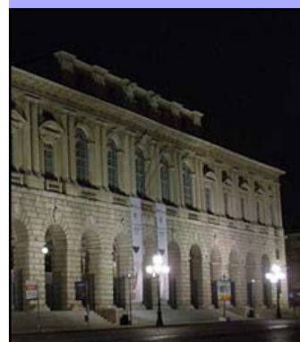
Il palazzo della Gran Guardia

Questa sera per la Giornata Mondiale per la lotta al Tumore al Pancreas, diverse città italiane, tra cui la Città di Noale, vedranno illuminati di viola palazzi, monumenti, edifici, piazze e luoghi simbolici e rappresentativi al fine creare consapevolezza sulle neoplasie pancreatiche e richiedere alle istituzioni di impegnarsi a promuovere informazioni e campagne di prevenzione. A Noale sarà illuminata la Torre dell'orologio. Promossa dalla Associazione Nastro Viola Onlus, con la collaborazione delle associazioni Fondazione Nadia Valsecchi Onlus, Associazione Oltre la Ricerca e Associazione My Everest Onlus, la campagna "Facciamo luce sul tumore al pancreas" è arrivata in Italia nel 2016 e ha riscosso un successo sempre crescente: grazie al tam tam di pazienti e familiari e all'impegno di istituzioni pubbliche e private l'anno scorso sono stati ben 80 i comuni che hanno aderito all'iniziativa. Tutto il mese di novembre è dedicato al tumore al pancreas. Tra le singole iniziative promosse dalle Associazioni, si segnala l'incontro nazionale - organizzato dalle Associazioni Nastro Viola Onlus, Fondazione Nadia Valsecchi Onlus e Oltre la Ricerca - che quest'anno si terrà a Verona il 16 novembre nella sala convegni del Palazzo della Gran Guardia.