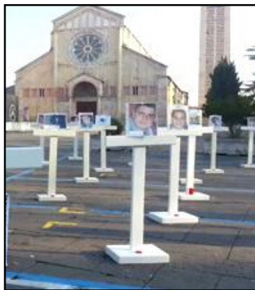
Le croci in piazza San Zeno

Con 50 croci in piazza San Zeno e altrettanti palloncini bianchi lanciati in cielo, Verona ricorda tutte le vittime della strada. La manifestazione si terrà domenica 18 novembre, dalle 8 alle 14, in occasione della Giornata Mondiale in 'Ricordo di tutte le Vittime della strada'. Oltre alle croci, per tutta la mattinata sarà allestito in piazza un punto informativo rivolto alla comunità. Alle 12, saranno liberati in cielo una cinquantina di palloncini bianchi a memoria di coloro che, ogni anno, perdono la vita sulla strada. Nelle serate di domenica e lunedì, grazie al contributo di Agsm, la Gran Guardia sarà illuminata di rosso in