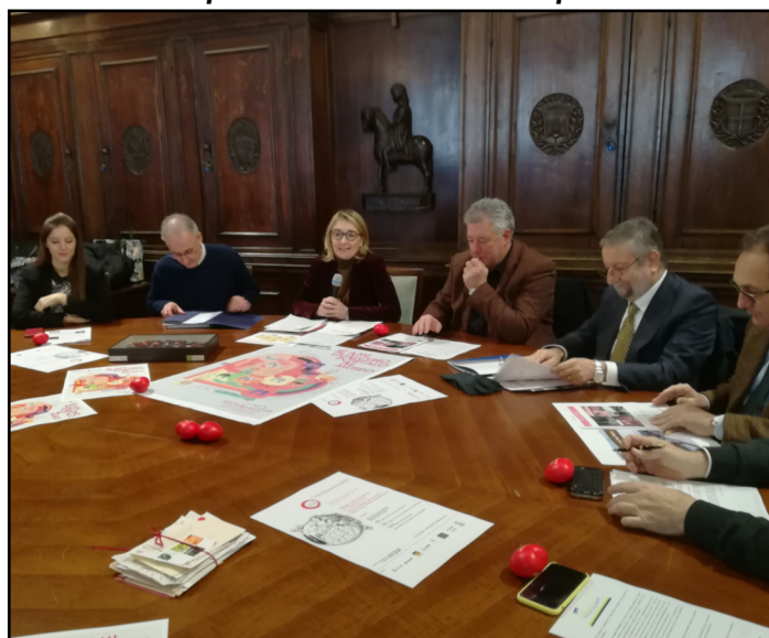
La presentazione dell'iniziativa

inoltre, Arena, Gran Guardia e Palazzo Barbieri saranno illuminati di rosso. Così come la Torre dei Lamberti e via Cappello, dove i cuori "guideranno" la passeggiata. Una strada sarà dedicata al "Dolcemente in love". In via Roma si potranno trovare i banchi dedicati alle specialità dolciarie. Grande novità anche in piazza dei Signori, dove, per la prima volta, oltre al tradizionale cuore rosso con il mercatino dell'artigianato, sarà realizzato un labirinto "verde", fatto di piante e siepi, al centro del quale le coppie si ritroveranno davanti alla riproduzione del balcone di Giulietta. All'interno della loggia di Fra' Giocondo, andranno in scena presentazioni, spettacoli e proiezioni, ma soprattutto saranno messi in vendita pezzi unici del "muro" di Giulietta. Le pareti del corridoio che portano al cortile di casa Capuleti, infatti, sono rivestite da una speciale tela che Agsm, ha deciso di togliere periodicamente e conservare, facendone delle opere uniche, certificate "Juliet Love Signature", che saranno acquistabili. Una parte del ricavato andrà al progetto "Villa Fantelli" di Abeo. E poi si potrà "adottare" un animale, "salvaguardare" il futuro di un albero e partecipare