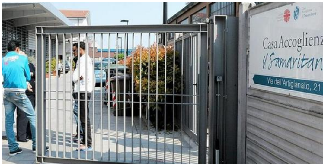
Al Samaritano restano sempre a disposizione 40 posti letto

Nuovi requisiti per aiuti caro bollette. Dopo avere distribuito già 1 milione di euro per i rincari di energia e gas, il Comune di Verona ha già pronto 1 altro milione per far fronte al rischio povertà energetica. Un nuovo bando che non terrà in considerazione solo l'Isee, quindi, ma anche una serie di nuovi parametri per colpire dritto nel segno, ossia andare ad individuare quei veronesi che potrebbero arrivare alla soglia della povertà e che,