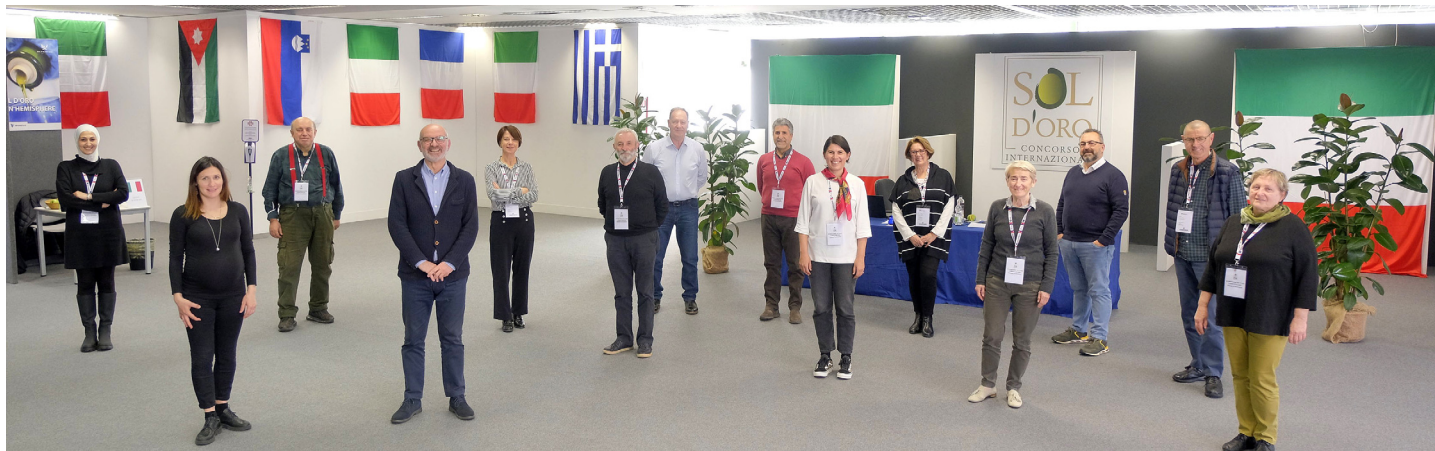
I componenti della giuria internazionale che hanno esaminato i campioni di olio extravergine provenienti da tutto il mondo

Per la prima volta Gran Menzione per un olio cinese. Sul podio Croazia e Spagna