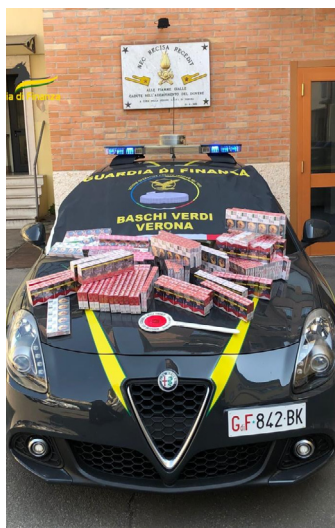
I tabacchi sequestrati dalla Finanza

Nei giorni scorsi, i finanzieri del Gruppo di Verona hanno svolto distinti servizi che hanno portato in un caso al sequestro, presso un negozio condotto da cittadini stranieri, di quasi 40 mila articoli accessori ai tabacchi da fumo, soprattutto filtri e cartine per il confezionamento di sigarette. Tali prodotti, assoggettati a specifica imposizione, dal 1° gennaio 2020, infatti,