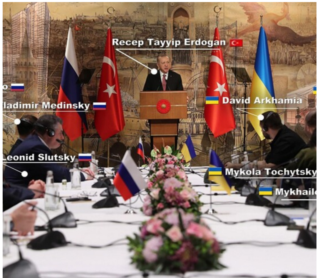
Il tavolo dei negoziati. In alto, Vladimir Putin

incontro fra il presidente ucraino Volodymyr Zelensky e il presidente russo Vladimir Putin. Lo afferma il negoziatore ucraino Mykhaylo Podolyak, citato dall'agenzia Bloomberg. Si è trattato del primo