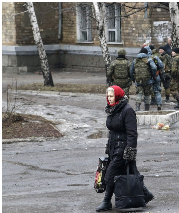
La guerra sconvolge anche l'economia

Nei giorni scorsi, poi, Putin ha annunciato le nuove intenzioni russe: niente stop alle forniture di gas all'Europa, ma saranno accettati solo