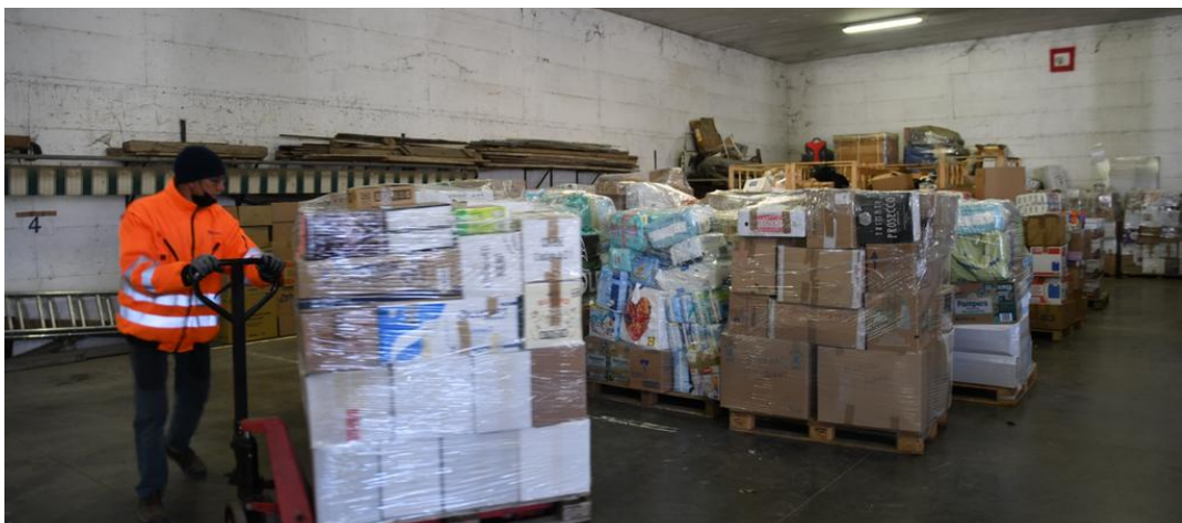
Il centro di raccolta al Quadrante Europa per gli aiuti all'Ucraina

È l'ultimo dei container ferroviari a partire, altri 11, caricati a Verona nelle scorse ore, sono appena arrivati a Monaco. All'interno vestiti, alimenti e tanta acqua. Ora tutti i prodotti verranno trasferiti su camion e viaggeranno fino al terminal di Regensburg e da lì, su dei mezzi di trasporto più piccoli arriveranno in Ucraina. Una staffetta umanitaria che porterà a destinazione 350 bancali di prodotti, donati da tutta Italia e non solo. Un carico