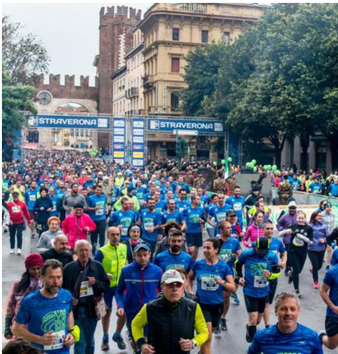
La Straverona in un'immagine d'archivio

L'edizione 39, organizzata da Associazione Straverona in collaborazione con il Comune e l'agenzia Dna Sport Consulting, punta al doppio traguardo. Scommessa di questo 2022: eliminare completamente la plastica dai per-