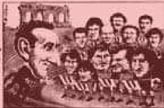
Nel momento di massima gioia i giocatori della Padova a Torino