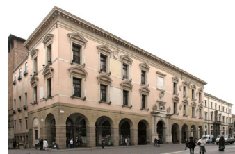
Il Palazzo del Bo'

"Nel suo ottocentesimo anniversario dalla fondazione, l'Università di Padova ha detto il presidente Luca Zaia - dimostra di essere predisposta ai più alti livelli qualitativi di didattica e ricerca e che potrà continuare per tanti secoli ancora ad affermarsi tra i più prestigiosi atenei del mondo. Oltre ad un glorioso passato, vanta importanza internazionale nel presente, proiettata in un sicuro futuro". Ben venti dipartimenti sono al primo posto con la massima valutazione di 100 e 9 giudicati comunque con punteggio sopra ai 90.