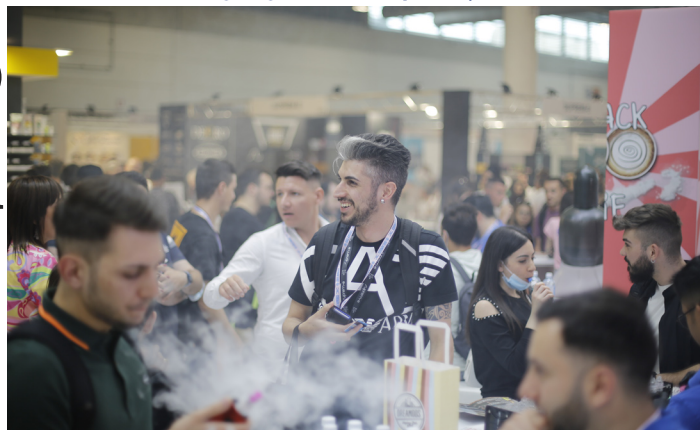
In Fiera per Vapitaly oltre 100 aziende

Oltre 100 le aziende presenti in fiera e 200 i brand rappresentati, anche dall'estero. Il 37% degli espositori arrivava da 14 Paesi nel mondo. Migliaia i visitatori che sono entrati nella superficie espositiva di 8.000 metri quadri, alla ricerca delle novità di mer-