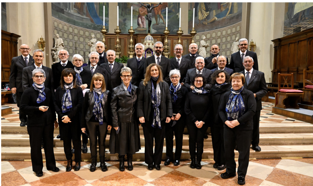
Corale S. Cecilia. Sotto la locandina di Pax Hominibus