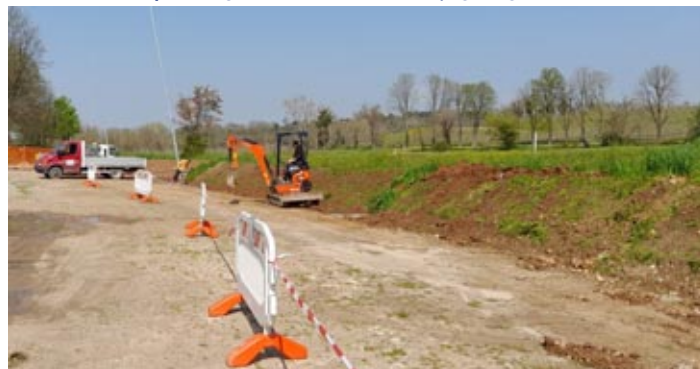
I lavori per l'illuminazione pubblica

È già in programma, per la seconda parte dell'anno, un ulteriore piano di interventi che interesserà