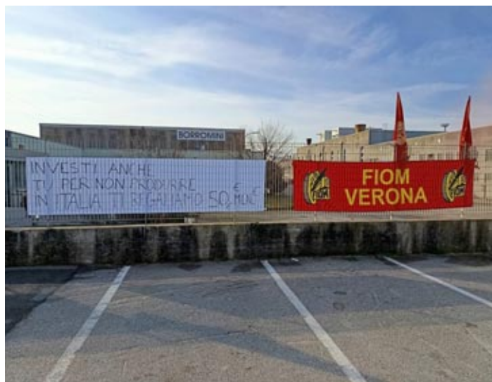
La protesta dei lavoratori alle Vetriere

Nel corso del primo incontro, si legge in una nota delle Rsu, Filctem Cgil - Uiltec Uil, era stata posta all'azienda una richiesta per mitigare l'impatto sociale della procedura di licenziamento collettivo con l'utilizzo di un ammortizzatore sociale come il contratto di solidarietà e contestualmente la disponibilità ad accettare la risoluzione dei rapporti di