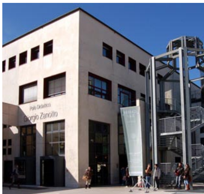
L'Università è frequentata da quasi 30 mila studenti

mo di tre anni e venuta meno la convenzione con l'ESU, gli edifici tornano sul mercato, seppure con degli obblighi di legge, rendendo difficile il controllo che siano effettivamente destinati agli studenti, oppure vengano trasformati in strutture ricettive turistiche.