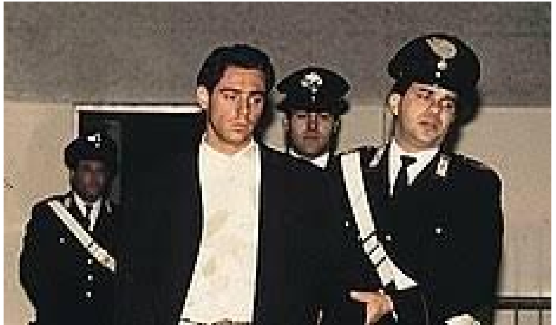
La vicenda di Pietro Maso è una di quelle che hanno avuto un'ampia risonanza mediatica

I programmi di cronaca nera possono infatti scaturire, se non ben gestiti, diversi "effetti collaterali" di natura psicologica, sugli spettatori a seconda della frequenza e dell'intensità con cui vengono "consumati" dagli stessi. Alcuni tra gli esiti negativi più comuni riguardano l'ansia e la paura, in quanto l'esposizione costante a notizie riguardanti la criminalità può aumentare i