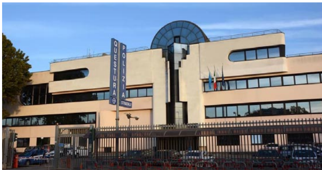
Il questore Rosaria Amato ha illustrato i risultati di un anno di lavoro

Particolarmente impegnativo è stato il lavoro per contrastare rapine, lesioni personali gravissime. Nell'ambito dell'attività