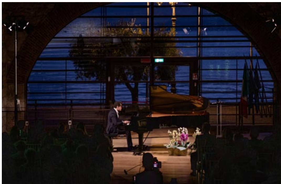
Un'esibizione della passata edizione del Garda Festival

L'edizione 2025 del Garda Festival si svolgerà dal 12 luglio al 14 agosto in diverse località sul Lago di Garda, tra cui Castelnovo del Garda, Desenzano del Garda, Lazise, Peschiera del Garda, Sirmione e Villafranca di