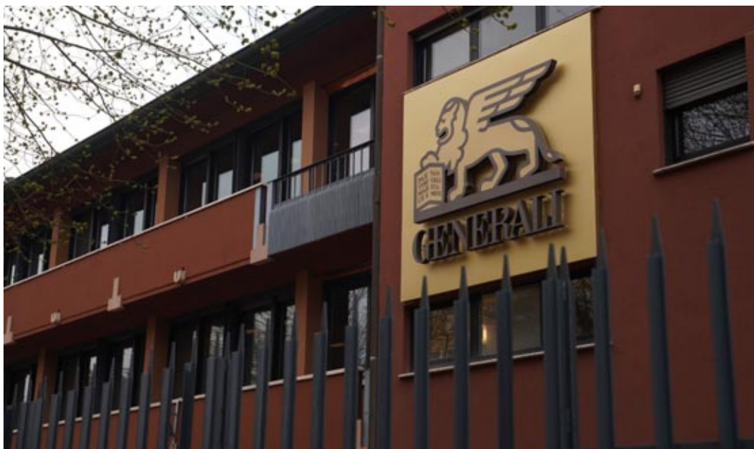
La nuova sede di Generali a Borgo Trento

Generali raccoglie oggi un'eredità importante, frutto di una storia radicata nel territorio e di un percorso che ha visto protagoniste realtà di primo piano del mondo assicurativo. È proprio da questa eredità che deve partire una nuova stagione di responsabilità e investimento sul territorio. Accanto alle rilevanti partecipazioni in Veronafiore e nella Fondazione Arena di Verona, è fondamentale che il gruppo rafforzi il proprio impegno a favore della città, sostenendo in maniera concreta e proporzionata alla crescita economica generata dall'integrazione tra le due assicurazioni. In particolare, è necessario valorizzare e sostenere la Fondazione Cattolica Assicurazioni, quale pre-