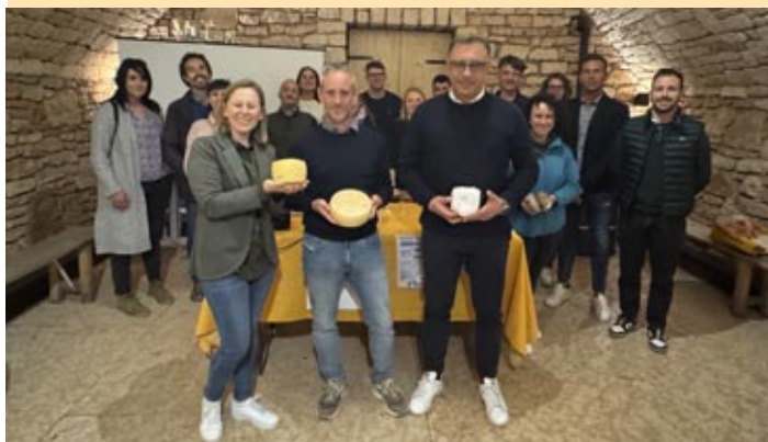
I GASTRÒNOMI della Lessinia

La premessa è semplice: dietro ogni euro speso, ogni prodotto scelto tra i molti a disposizione, c'è una scelta. Una decisione non sempre consapevole. I GASTRÒNOMI della Lessinia puntano ad aumentare questa consapevolezza, promuovendo il territorio, informando – anche con attività nelle scuole – sulle ricchezze che i monti lessini hanno da offrire, su prodotti e produttori locali.