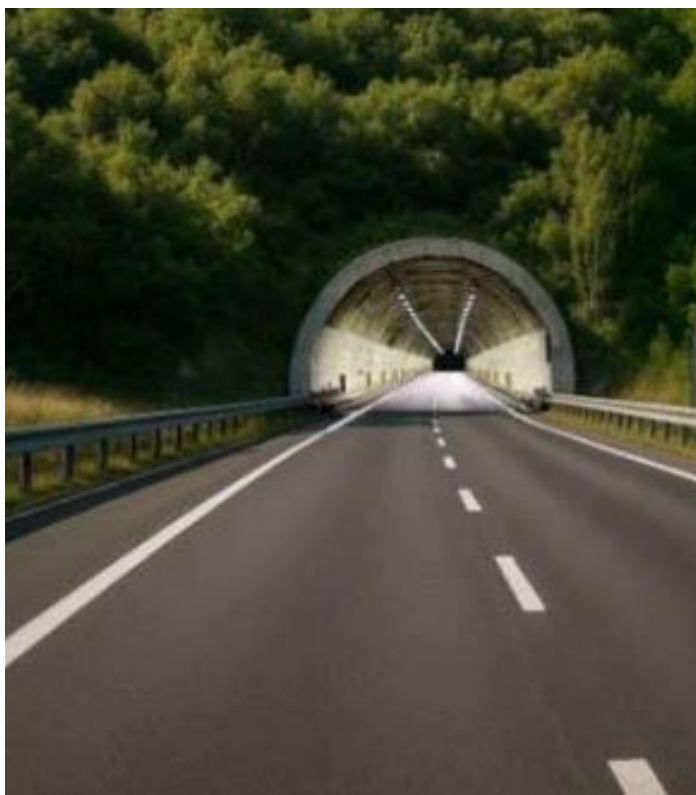
Il rendering del traforo

Primo aspetto importante da sottolineare è che non esiste il traforo, ma esistono i trafori. Uno breve (tra via Cipolla e via Nieve), uno medio (tra via Fincato e via Preare) e uno lungo (tra via Poiano e Ca' di Cozzi). L'unica via fattibile, per questione di costi e complessità è quello breve.