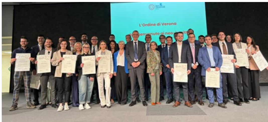
I neo iscritti all'Ordine