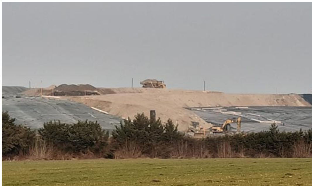
La discarica Ca' Bianca