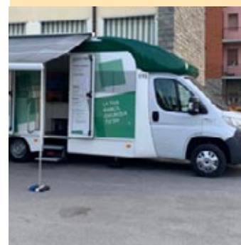
La banca mobile

Ogni settimana, il mezzo, facilmente riconoscibile grazie alla grafica istituzionale Intesa Sanpaolo, sosterrà in piazza Aldo Moro, ospitando due gestori della Banca che accoglieranno i clienti, offrendo consulenza sui principali prodotti e servizi bancari. Inoltre, sarà possibile ricevere supporto per l'utilizzo dell'app e dell'Internet banking Intesa Sanpaolo, per operare in autonomia e sicurezza sui propri rapporti di conto.