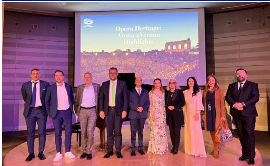
Gli europarlamentari veronesi e veneti alla presentazione della stagione lirica