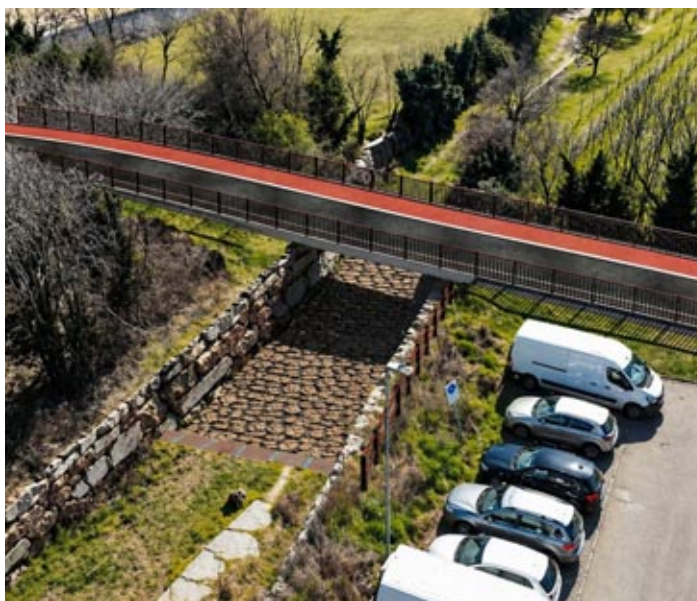
Il rendering del ponte ad Avesa