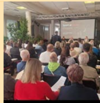
Un momento del convegno