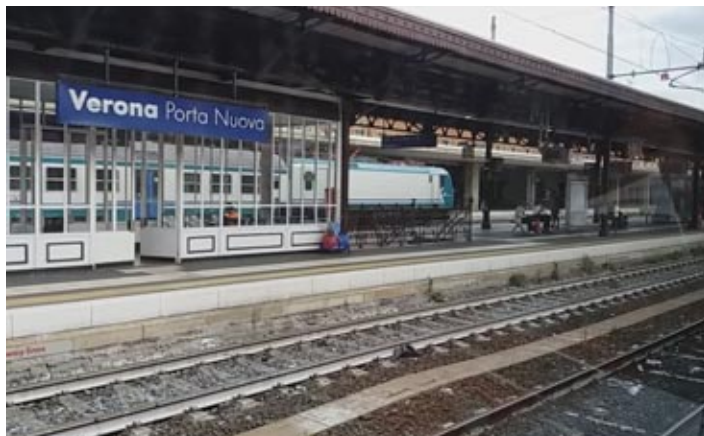
La stazione di Verona Porta Nuova

Gli interventi comportano in alcuni casi la necessità di interrompere la circolazione