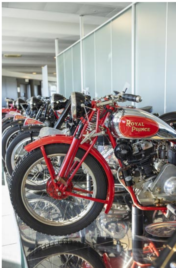
Il Museo Nicolis a Villafranca

In un momento storico in cui è importante richiedere supporto, il DGR porta nelle piazze e nelle strade un messaggio forte e