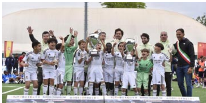
Il Real Madrid trionfa alla Bardolino Champions Cup

Gli spagnoli hanno avuto la meglio su Juve e Porto, gli scaligeri contro Genk e PSG