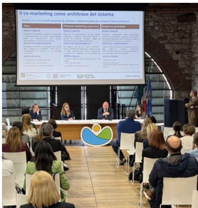
L'evento a Lazise