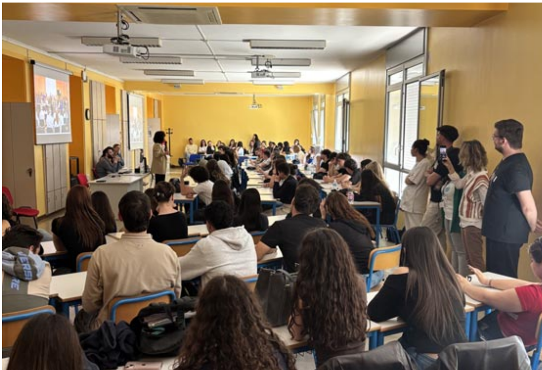
Un momento del recente open day a Legnago