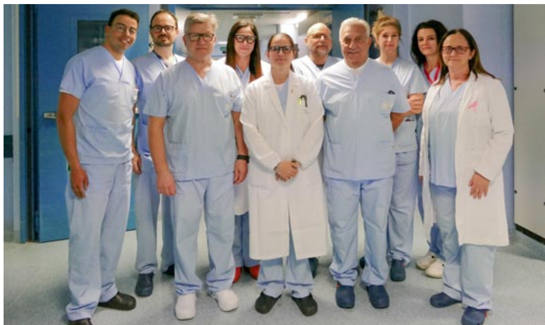
L'équipe di Chirurgia Plastica