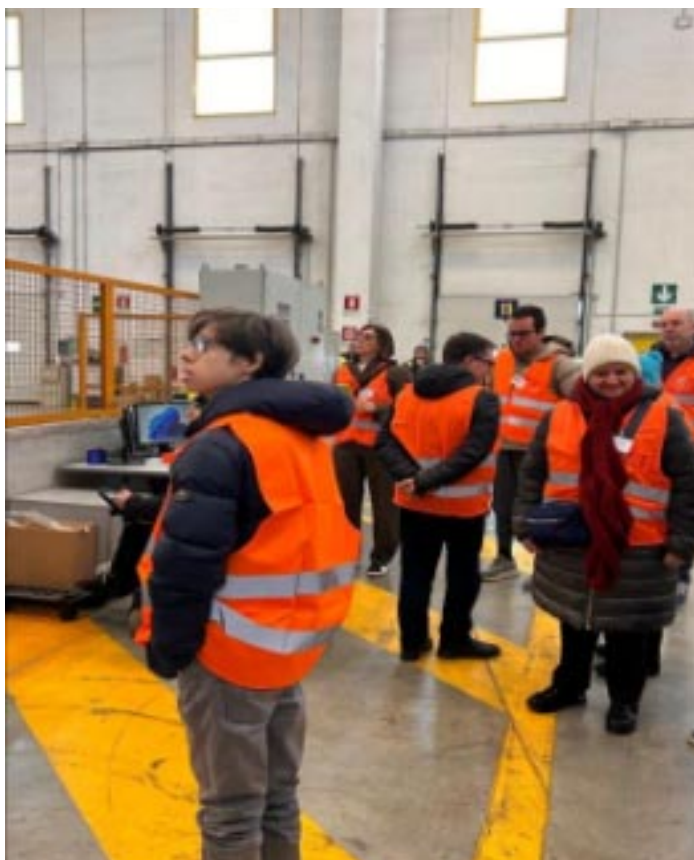
I ragazzi de “La Ginestra” in visita al centro logistico

«Il nostro sguardo si rivolge al mondo aziendale, la nostra missione è promuovere contesti aziendali responsabili, dove la miglior performance coincide con la valorizzazione di ogni singola risorsa e del suo potenziale. L’inserimento lavorativo di persone fragili è un potente catalizzatore di efficien-