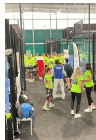
Il torneo di padel al Platys Center

in provincia di Verona nell'ottobre 2025, il progetto mira a rendere lo sport più accessibile, equo e rispettoso per donne e ragazze, attraverso campagne di sensibilizzazione, attività scolastiche, formazione per tecnici e un linguaggio non stereotipato nei media.