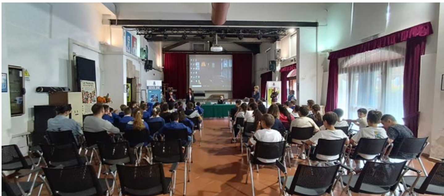
L'incontro a Bovolone