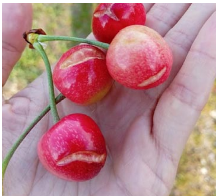
I danni causati dal maltempo