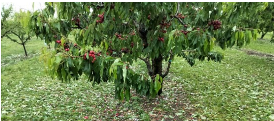
I danni causati a Pastrengo e San Michele

Situazione da monitorare anche in Valpolicella, dove è caduta grandine