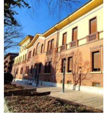
La casa di riposo di Legnago