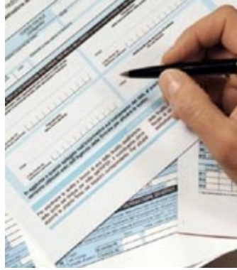
Il modulo 730