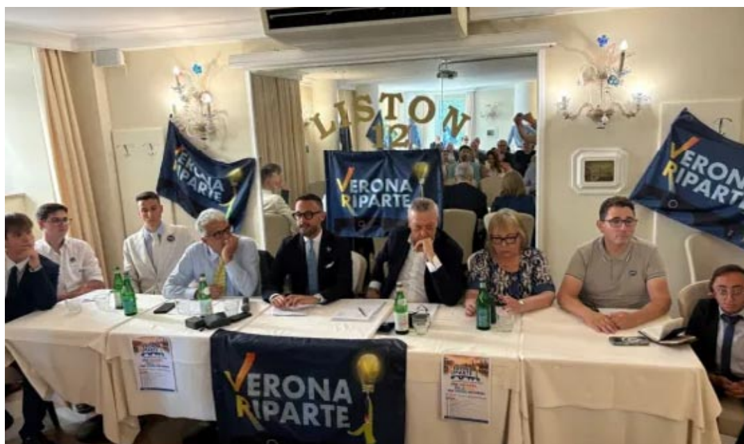
La conferenza stampa di presentazione

Una premessa, però, che non cancella il significato politico dell'iniziativa. Anzi. Mentre il centrodestra non ha ancora