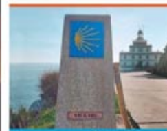
Finisterre MERCATO DI