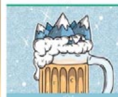
Sierra Nevada BARCEL